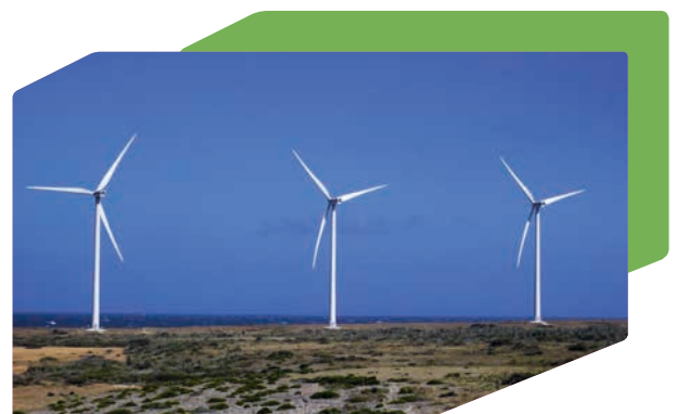
Windenergie ist umweltfreundlich: Klimakompensationsprojekt in Vader Piet, Aruba

Um die Herstellung von Produktionsdruckgeräten klimaneutral zu gestalten, unterstützen wir ein CER-Projekt (Certified Emission Reduction) in Liaoning, China. Im Kohlebergbau werden zur Sicherung der Grube aus unterirdischen Bohrlöchern große Mengen austretenden Methans aus Sicherheitsgründen abgesaugt. Dieses Gas wird gesammelt und in der Region wiederverwendet.